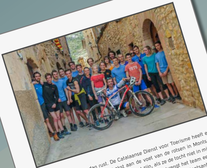
DAG 6 Tijd voor een tweede dag rust. De Catalaanse Dienst voor Toerisme heeft een mountainbiketocht in elkaar gebokst aan de voet van de rotsen in Montsant. Het Belgian Climbing Team zou het BCT niet zijn, als ze de tocht niet in minder dan de helft van de voorziene tijd afwerken... Nadien brengt het team een bezoek aan Cartoixa d'Escaladei, een klooster in de bergen nabij Montsant.