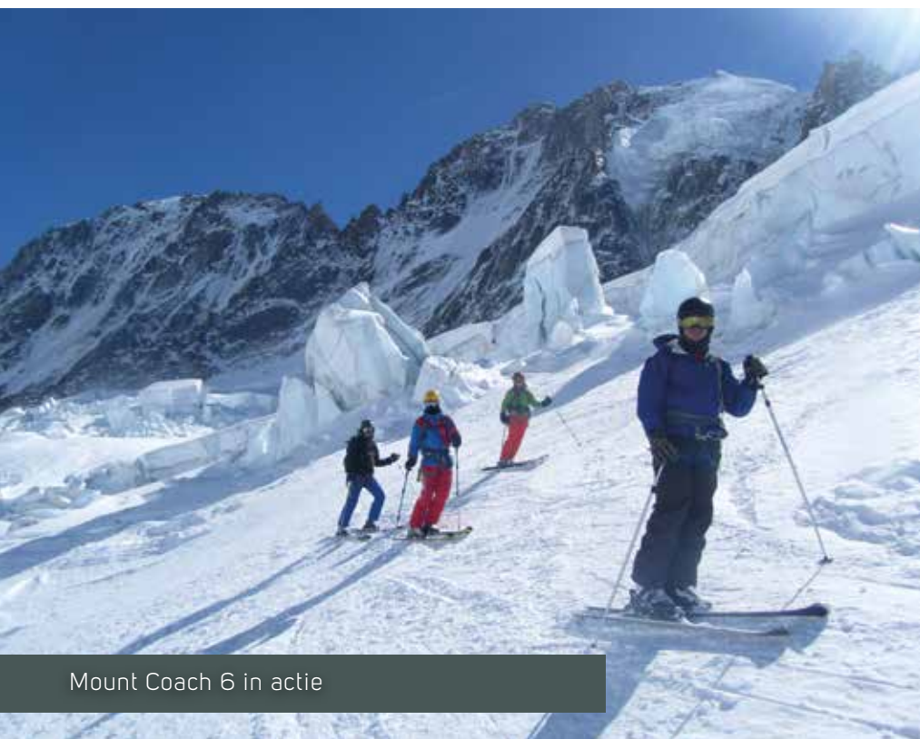
Mount Coach 6 in actie

Deze zomer is het de beurt aan MC6. Zij trekken op expeditie naar de Cordillera Blanca in Peru. Benieuwd met welke enthousiaste verhalen zij zullen terugkomen!