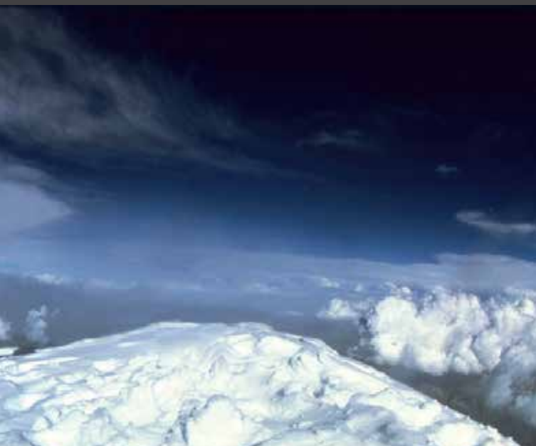
foto links en pagina 23: als eerste mens ter wereld volbracht Messner een solobeklimming van een achtduizender, de Nanga Parbat.